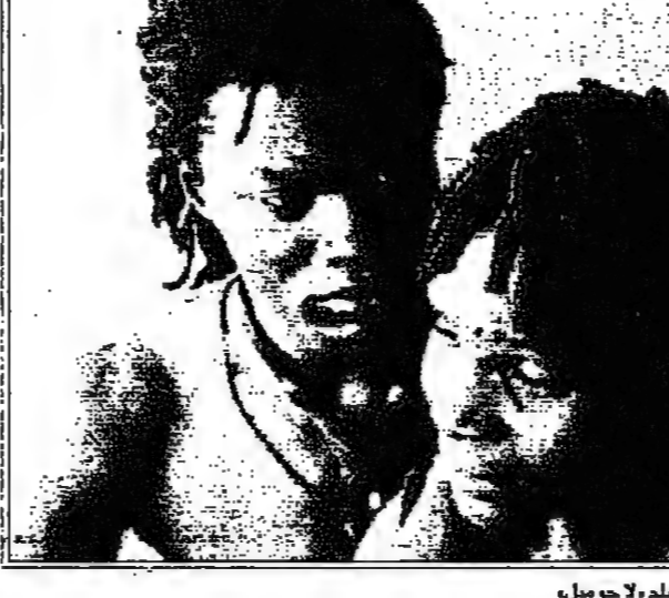
لغلة من فيلم ل جوميل